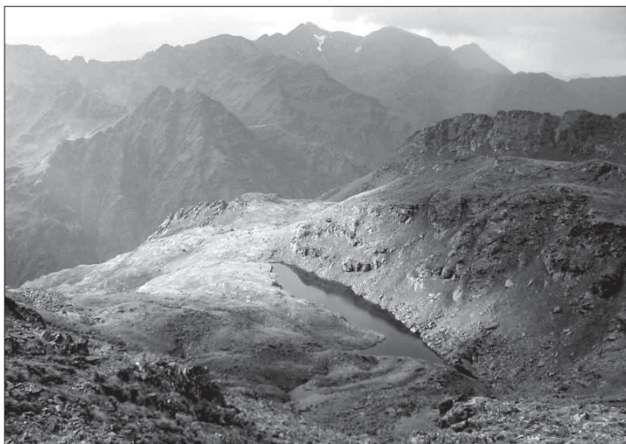
La Pica d'Estats i el Montcalm des del Port de Creussans, per on va passar Verdaguer

Les descripcions van sovint entrelaçades amb les paraules del poeta, car, en els casos en què ha estat possible, és ell i