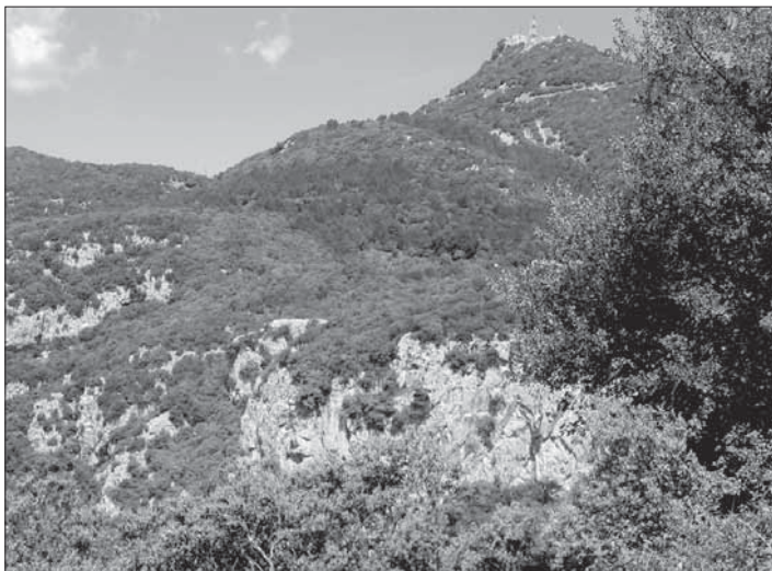
Pujant al santuari del Mont

O h. Un cop a l'església romànica de Beuda (Sant Feliu), prenem la carretera que passa per la seva esquerra en direcció a Segueró. Passada la riera de Font Fresca, ens trobem el camí senyalitzat a mà esquerra.