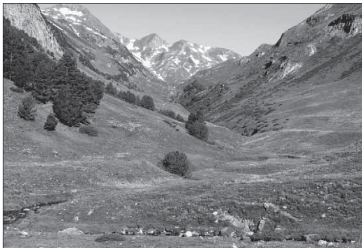
Parros i la vall de Vernatar tot pujant cap a la l'Estanh Nere, en el recorregut que el poeta va fer l'estiu del 1883

Les abreviacions utilitzades en els itineraris són prou conegudes dins del món de l'excursionisme. En destaquem sobretot els GR, senders de gran recorregut (llargues rutes senyalitzades amb dues franges, vermella i blanca, sovint transfrontereres, enfront dels PR, senders de petit recorregut, senyalitzats amb una franja groga i una altra de blanca). També es fa referència sovint a l'Alta Ruta Pirinenca (HRP o ARP) que, de cap a cap, d'est a oest, segueix els trams més enlairats de la serralada, i el Gran Recorregut del Principat (GRP), per Andorra. Pel que fa a les dificultats seguim, en algun cas puntual, la classificació més àmpliament difosa de PD (poc difícil), en contraposició a F (sense cap mena de dificultat) i AD (bastant difícil). Igualment hem esmentat la dificultat de la grimpada amb I, II o III grau.