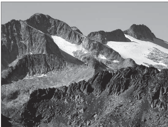
"Des del cim se veu [...] les Maleides de ple a ple". Panoràmica des del Tuc de Monges