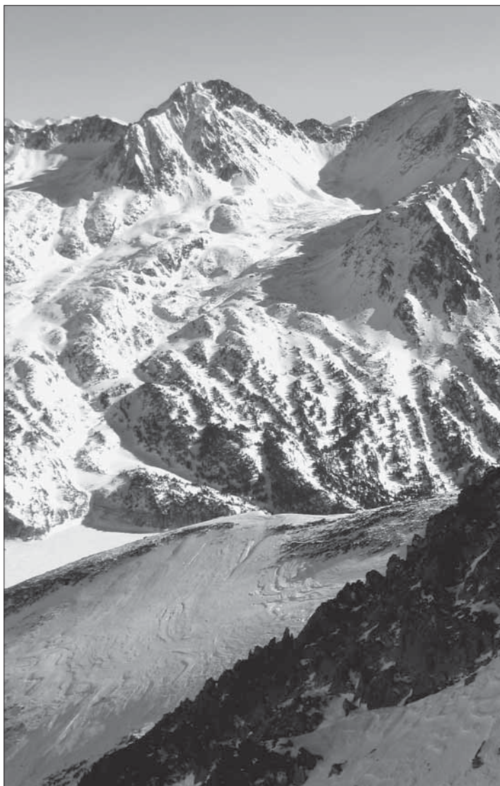
El Carlit des del costat de Lanós